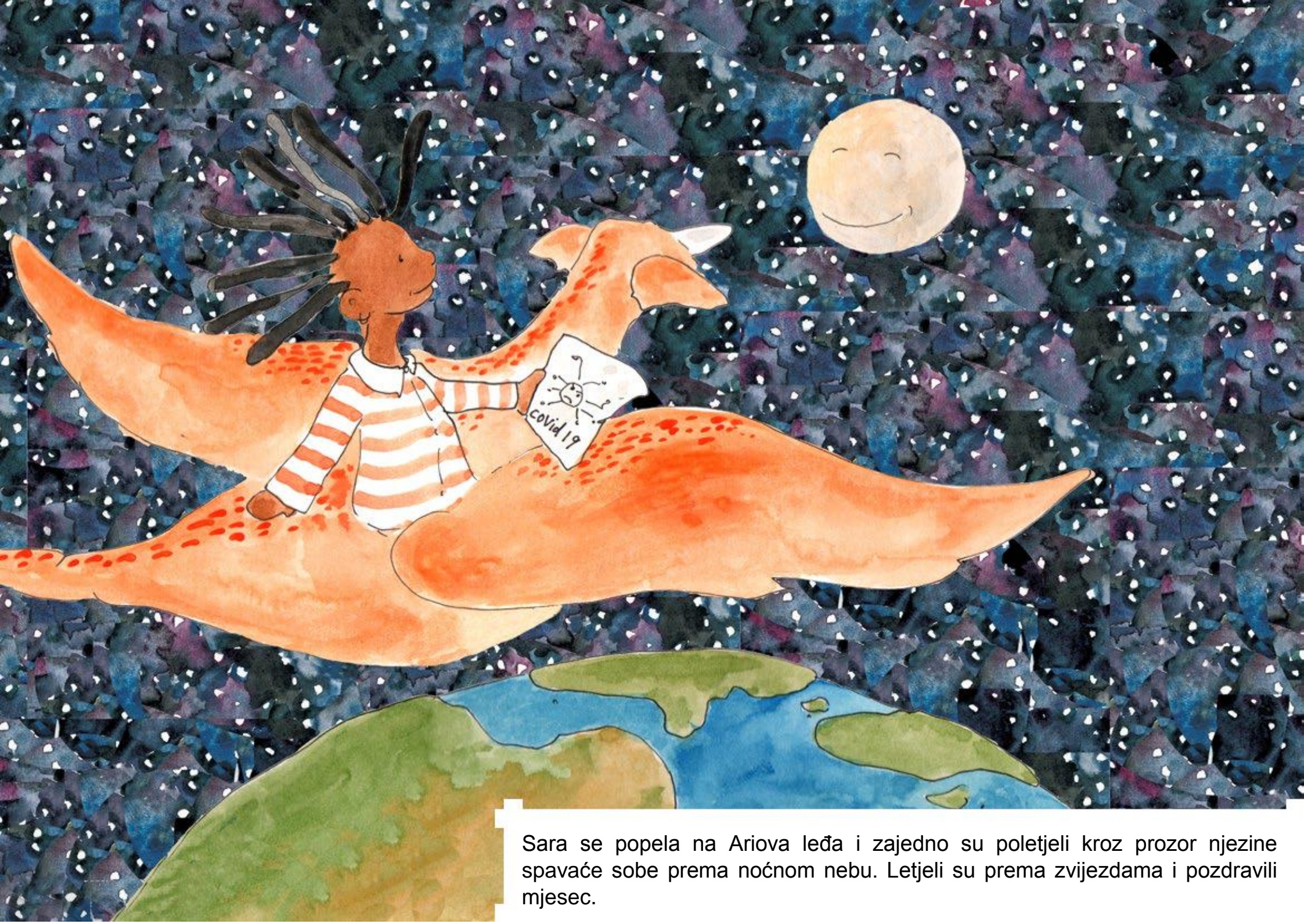
Sara se popela na Arioiva leđa i zajedno su poletjeli kroz prozor njezine spavaće sobe prema noćnom nebu. Letjeli su prema zvijezdama i pozdravili mjesec.